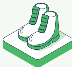
Спецобувь с жестким подноском (в зимнее время – утепленные ботинки)